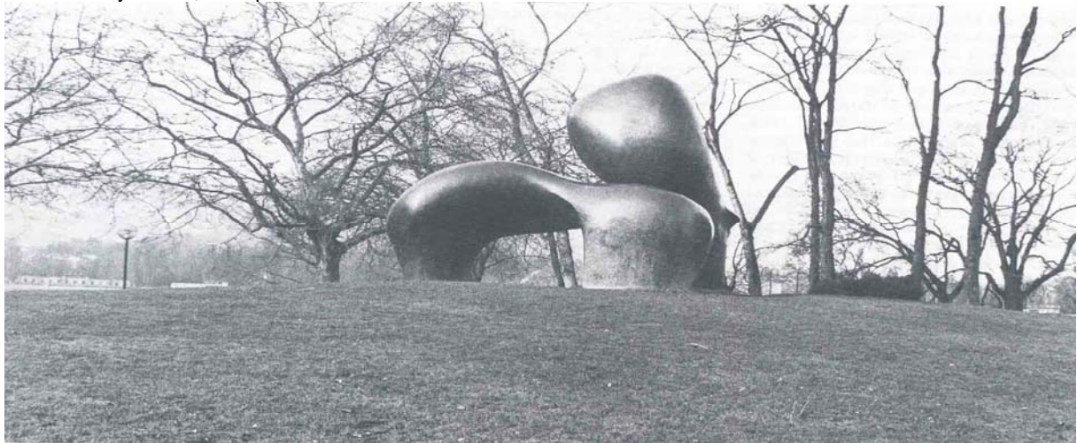
Afb 1: Henry Moore, Sheep Piece

Architecten willen in het algemeen met hun projecten ruimte creëren, maar wat verstaan we eigenlijk onder het begrip ruimtelijkheid? Hierboven is een omschrijven van ruimtelijkheid gegeven. Naar mijn mening is ruimtelijkheid een ervaring en niet onder één definitie te vangen. Wat is eigenlijk het soort ruimtelijkheid waar architecten, stedenbouwers en waarschijnlijk kunstenaars en ontwerpers in het algemeen naar streven? Het is een gevoel dat je ervaart in een ruimte of bij een object. Ieder object omvat ruimte, maar de manier waarop is kan totaal verschillend zijn, vandaar ook dat het ene object of die ene ruimte veel ruimtelijker wordt ervaren dan de ander.